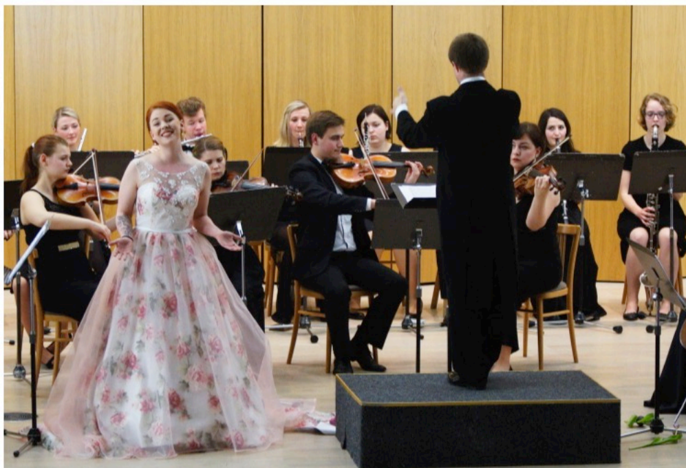
Orchestrální absolventský koncert