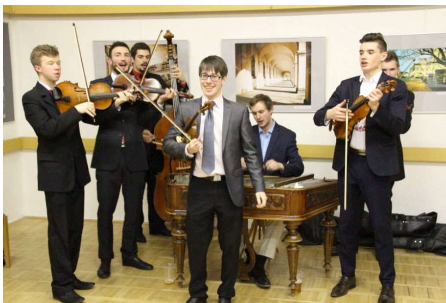
Cimbálová muzika konzervatoře

Tradiční „Muzikantský ples“, který pořádají společně Konzervatoř P. J. Vejvanovského Kroměříž a ZUŠ Kroměříž, se uskutečnil 9. března 2018 v Domě kultury Kroměříž. Jako vždy se na pódiu střídali jak profesionální hudebníci, tak seskupení studentů a žáků obou škol (Dechová hudba, cimbálová muzika).