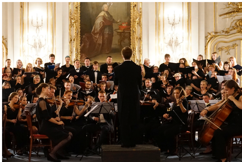
Orchestr a sbor konzervatoře

Program našeho koncertu nabídl v první části širokou škálu stylově odlišných skladeb pro různá obsazení. Druhá polovina večera byla zaměřena na dílo Antonína Dvořáka, kdy posluchači konzervatoře provedli slavnou Mši D – dur „Lužanskou“.